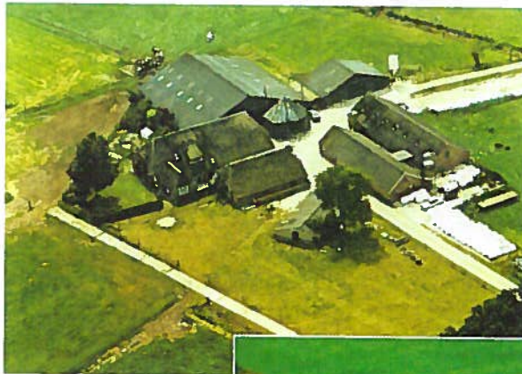
De Pauline's Hoeve op het landgoed vóór en na de sloop van voormalige bedrijfsgebouwen. De sloop vond plaats in het kader van de pilot 'Rood-voor-Groen op bestaande landgoederen'.