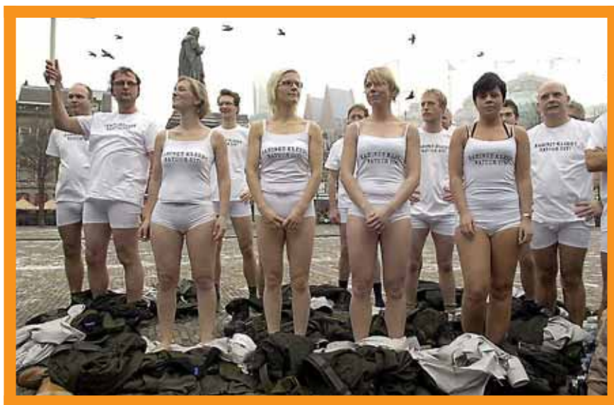
• Boswachters kleeden zich vorige maand in Den Haag uit als protest tegen de kabinetsplannen over de natuur.