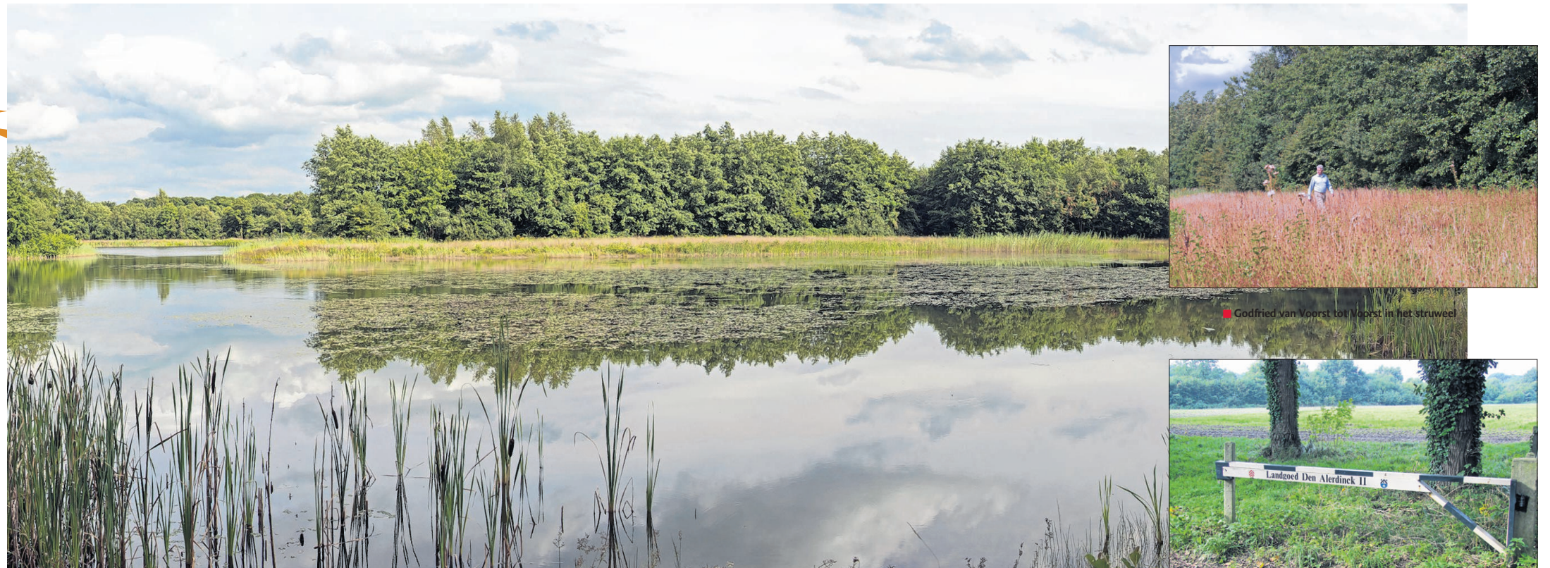
■ De waterplas op landgoed Den Alerdinck II. Ruim 88000 m3 zand werd weggegraven, zo'n 4500 vrachtwagens. „De zandopbrengst was net genoeg om dit project zonder inrichtingssubsidie uit te voeren.“