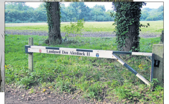
■ Een van de tolbomen die toegang geven tot landgoed Den Alerdinck II.